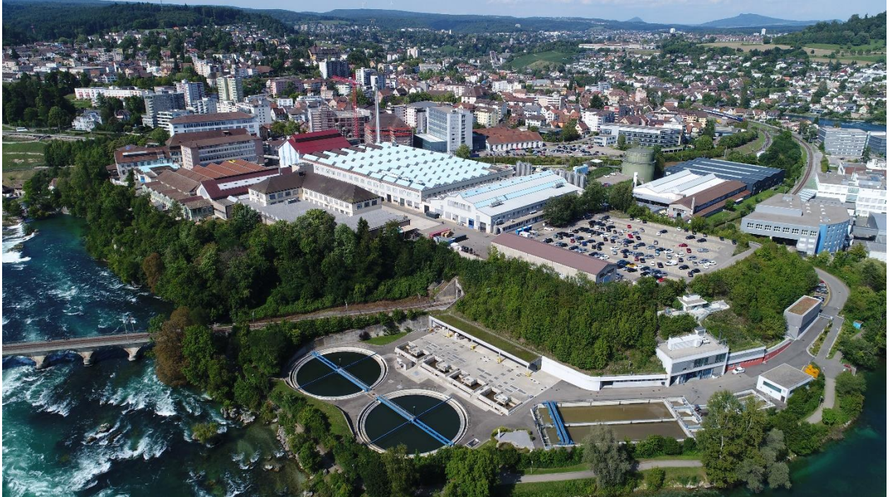
Foto Luftbildaufnahme Kläranlage Rötti